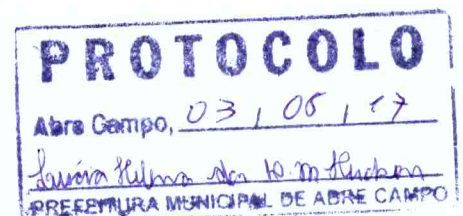
_____ Márcio Moreira Vítor Prefeito Municipal